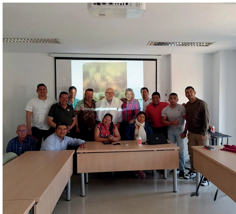
Continúa en la siguiente página

dinamizar una política sindical de prevención de las enfermedades y los accidentes laborales y de promoción del bienestar y la salud en general.